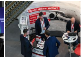
Impressionen vom AWT 2023 in Düsseldorf