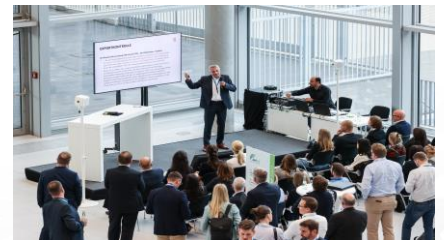
Impressionen vom AWT 2023 in Düsseldorf